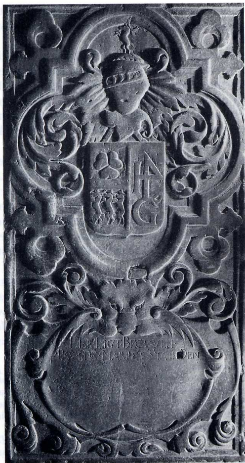
Grafzerk van Pau de Marres, oorspronkelijk in de kerk van het Kruissherenklooster te Maastricht, in de Franse tijd overgebracht naar de St. Janskerk aldaar.