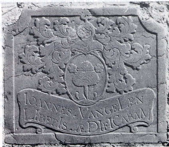
Steen in de achtergevel van het „Pannenhuis” te Biesland; het jaartal van de bouw (1710) is als chronogram in de tekst opgenomen.