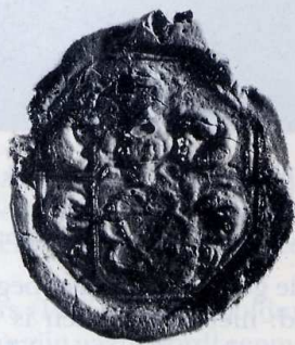
Zegel van Pau de Marres uit 1701.